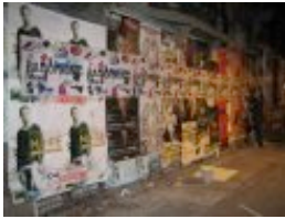
L'affiche de Radiophonic 2007, radio-laboratoire, véritable espace de création sonore.